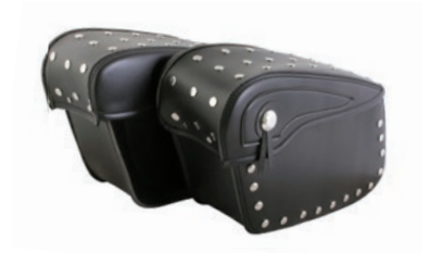
KUFRY - MOTOCYKLE