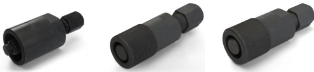
SCIĄGACZE KOŁ MAGNESOWYCH