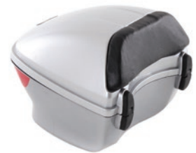
KUFRY - SKUTERY